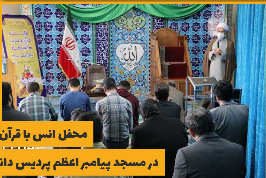
محفل انس با قرآن کریم