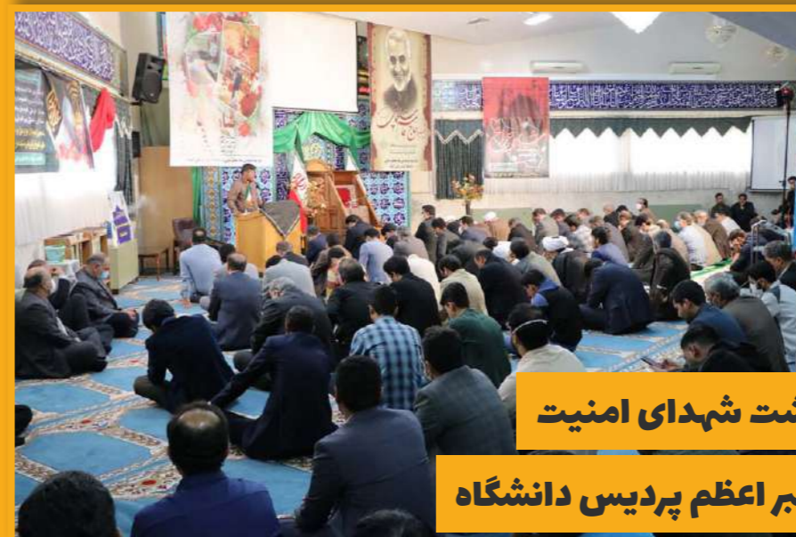
مراسم بزرگداشت شهدای امنیت