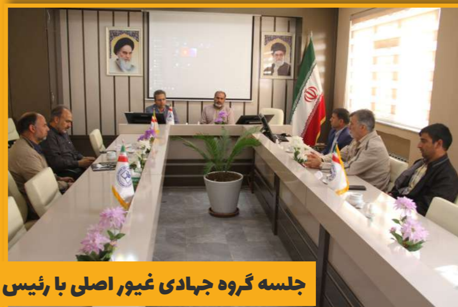
جلسه گروه جهادی غیور اصلی با رئیس دانشگاه