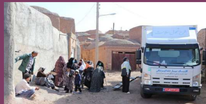
روستای صلح آباد