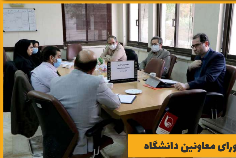
جلسه شورای معاونین دانشگاه