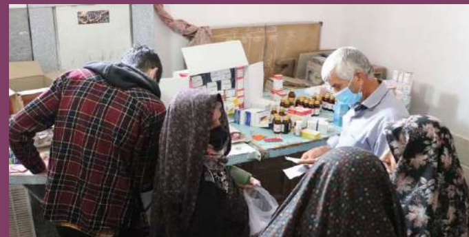
روستای نوده پشنگ