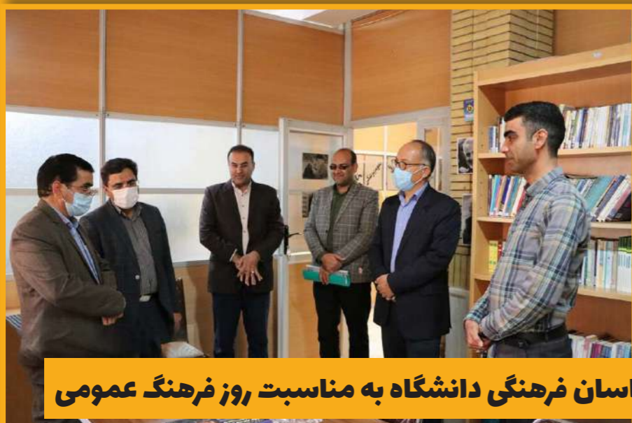
تقدیر از کارشناسان فرهنگی دانشگاه به مناسبت روز فرهنگ عمومی