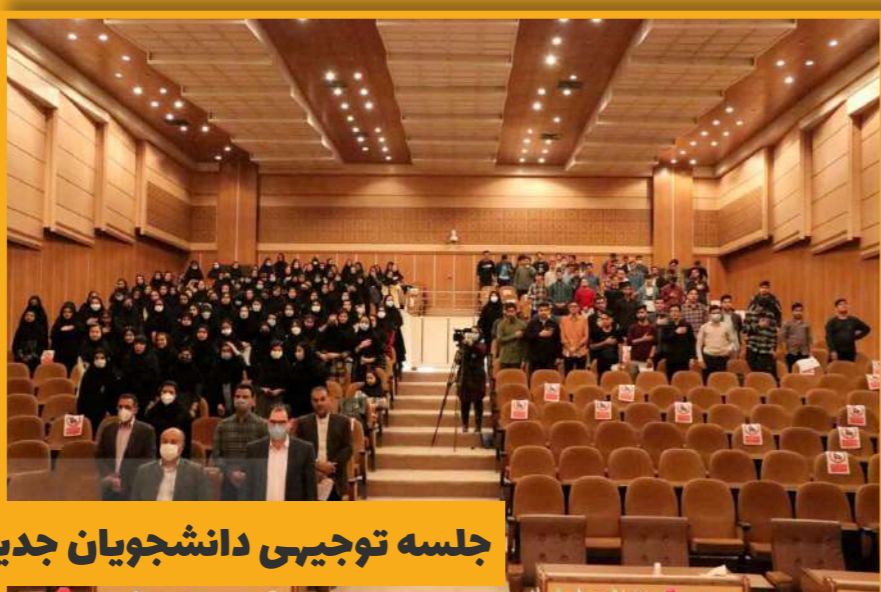
جلسه توجیهی دانشجویان جدیدالورود