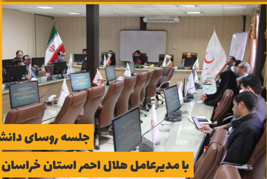
جلسه روسای دانشگاهها