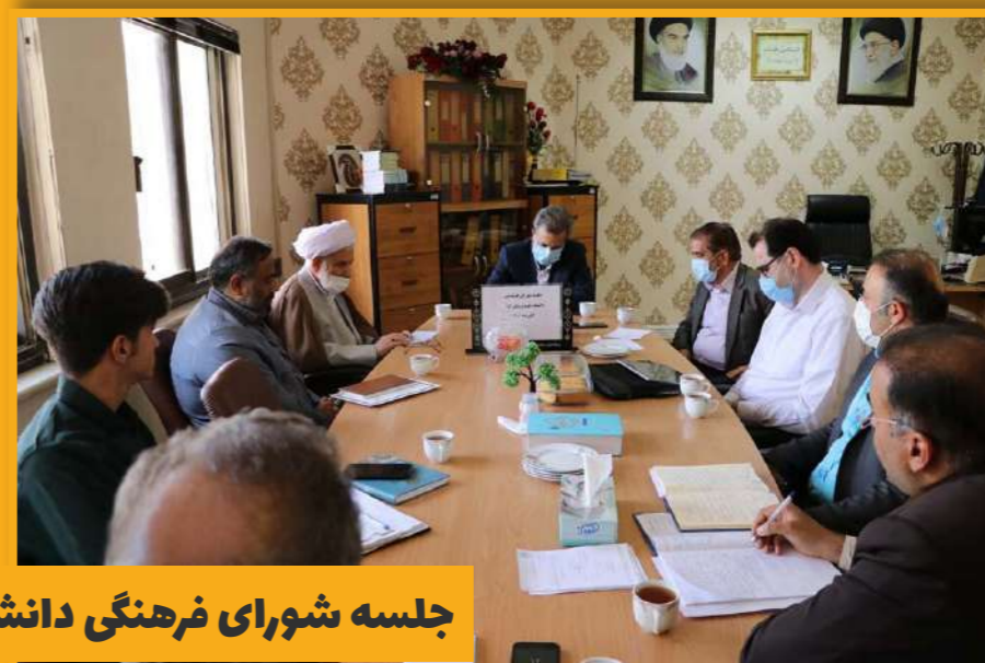
جلسه شورای فرهنگی دانشگاه