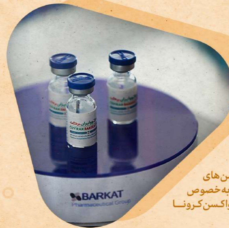
ساخت واکسن های پیچیده به خصوص واکسن کرونا