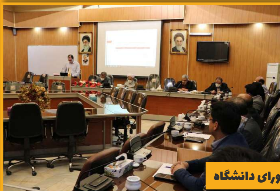
جلسه شورای دانشگاه