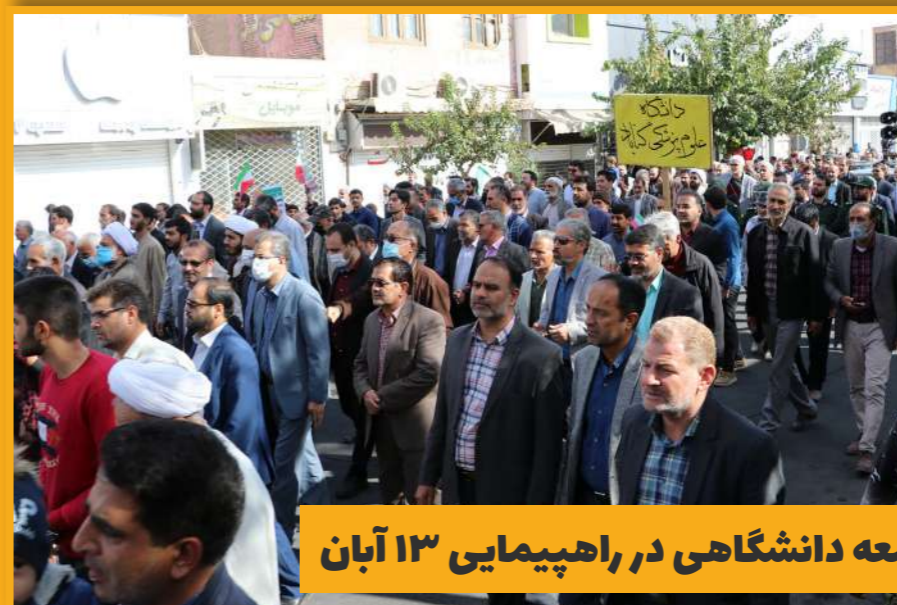
حضور جامعه دانشگاهی در راهپیمایی ۱۳ آبان