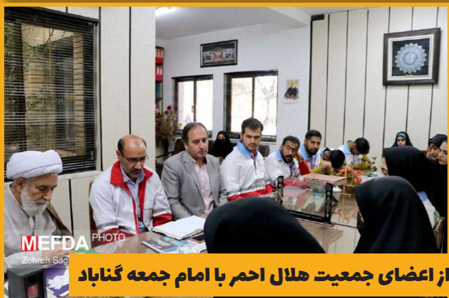
دیدار جمعی از اعضای جمعیت هلال احمر با امام جمعه گناباد